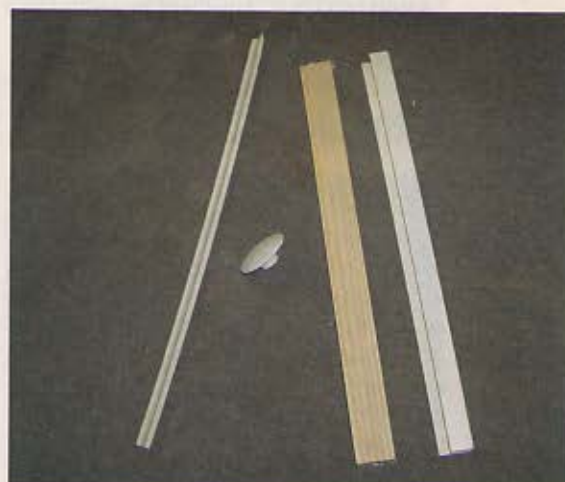
Pomocný materiál – krycie škárovacie lišty, ozdobný plastový gombík, drevená podkladová lišta, vzorka ukončovacej plastovej lišty