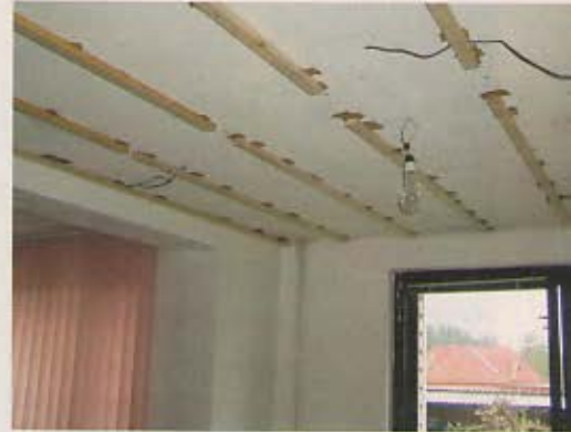
1. K stropu priskrutkujeme roštovanie z hranolov. Nerovnosti vyrovnáme podložením.