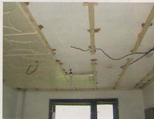
2. Ak chceme namontovať stropné svetidlá, k vybraným kazetám musíme priviesť vodiče. Prácu s rozvodmi by mala vykonať len oprávnená osoba.