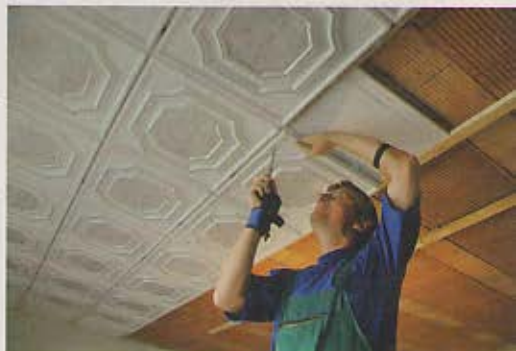
3. K hranolom postupne skrutkujeme kazety (v tomto prípade imitácia barokového stropu) s potlačou a tapetou. Pomocou polystyrénových platní môžeme strop zaizolovať.