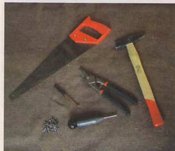
Náradie – kladivko na pribíjanie podhládov a ukončovacích lišt, pílika, nožnice, kladivo, klinčeky, rozperná príchytka a skrutka

Foto a kresby: autor, Stanislav Botur, Peter Fischer, Soňa Straková, Knauf, Rigips