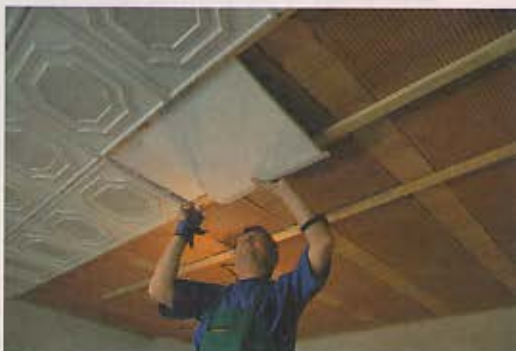
4. Montáž kaziet s použitím špeciálneho kladivka na pribíjanie podhládov a ukončovacích lišt.

„Remeselníci nám pri stavaní domu neodviedli dobrú prácu – ostali nám po nich krivé stropy. Rozmýšľali sme preto, čím ich obložíme. Polystyrénové kazety sme nechceli, pretože sa lepia a strop nevyrovnejú, hľadali sme teda inú variantu. Priateľka nám odporučila plastové stropné podhlády,“ napísala nám naša čitateľka, majiteľka nového domu. Príkladá návod, ako si možno svojpomocne zhotoví plastový obklad.