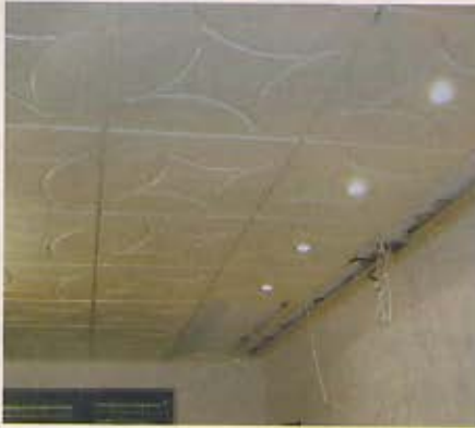
5. Pri stene bolo treba kazety rezať. Na rezanie kaziet možno použiť píliku na drevo.

sme pribili na podkladové drevené laty ukončovacie plastové lišty.