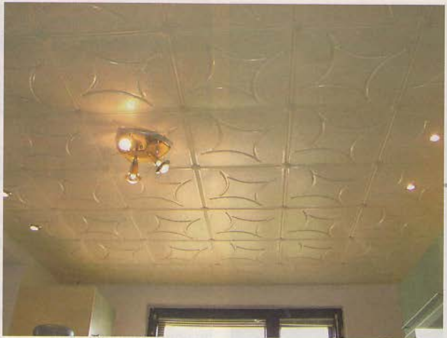
6. Pohľad na hotový kuchynský strop

Medzi výhody plastových podhládov patrí suchý proces montáže a prekrytie nerovného podkladu. Pod podhlády sme schovali aj všetky káble rozvodu elektrického prúdu. Vďaka polystyrénu, ktorý sme dali do obývacej izby pod podhlády, sme miestnosť zateplili a ušetrili sme tak náklady na energiu. Ďalšou výhodou je, že strop už nemusíme nikdy maľovať. Stropy sa ani nemusia udržiavať, vraj stačí občas